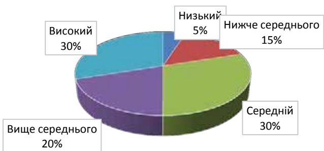
Рис. 2. Кількісні показники рівня ворожості за методикою «Опитувальник ворожості Басса-Даркі»

Низький рівень конфліктності відсутній взагалі. Кількісні показники отриманих результатів відображено на рисунку 1.