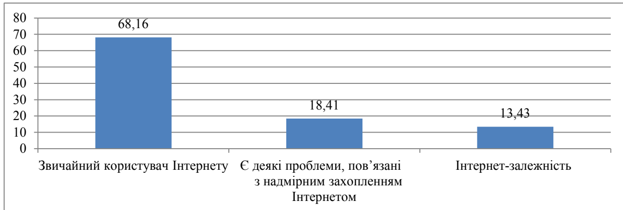
Рис. 2. Результати за тестом на інтернет-залежність Кімберлі Янг в адаптації В.О. Бурової (В.О. Лоскутової, 1999 р.)

нет-залежність Кімберлі Янг в адаптації В.О. Бурової (В.О. Лоскутової, 1999 р.), тест «Шкала інтернет-залежності Чена» (S.H. Спен, 2003 р.) в адаптації К.О. Феклісова, тест на інтернет-залежності С.А. Кулакова, «Опитувальник на кіберкомунікативну залежність» (А.В. Тончева, 2012 р.) тощо.