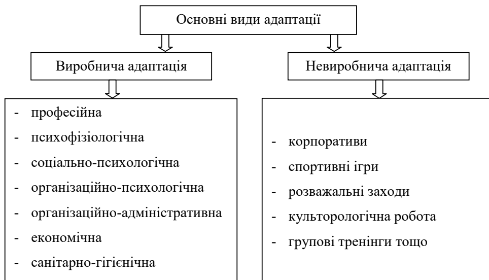
Рис. 2. Основні види адаптації

Темперамент визначає стиль поведінки людини, способи, яким людина користується для організації своєї діяльності. Тому при вивченні рис темпераменту зусилля повинні бути спрямовані не на їх зміни, а на пізнання особливостей темпераменту для визначення роду діяльності людини. За темпераментом люди діляться на чотири групи: сангвініки, холеріки, флегматики й меланхоліки.