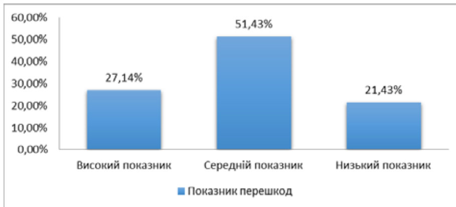
Рис. 3. Результати дослідження за методикою діагностики «перешкод» у встановленні емоційних контактів (n=70)

тривожності ( t=-0,594, p \leq 0,01 ), самооцінної тривожності ( t=-0,625, p \leq 0,01 ), міжособистісної тривожності ( t=-0,541, p \leq 0,01 ). Отже, високий рівень оцінки психологічного клімату вказує на низькі показники шкільної, міжособистісної та самооцінної тривожності.