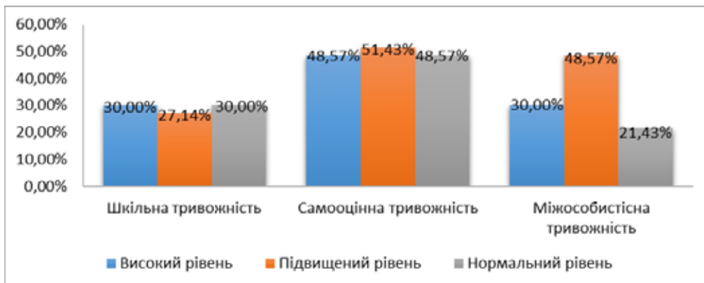
Рис. 1. Результати дослідження за методикою «Шкала тривожності» (n=70)

– показник оцінки психологічного клімату має зворотні зв'язки з показниками шкільної