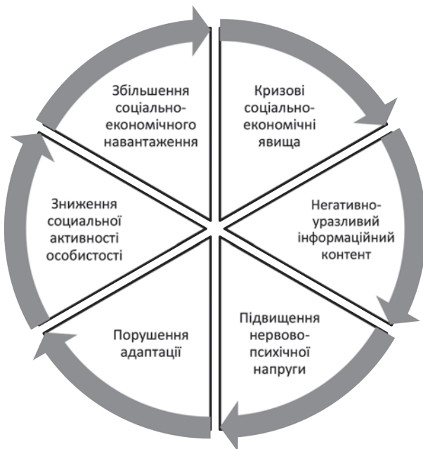
Рис. 3. Модель соціально-психологічних наслідків соціально-економічних негараздів

Поряд із економічними негараздами, що і так зазнає кожна людина, негативні відчуття і емоції значно примножуються засобами масової комунікації. Можна вибудувати певний ситуаційний ланцюжок економічної і психологічної небезпеки, що зазнає особистість у соціумі (рис. 3).