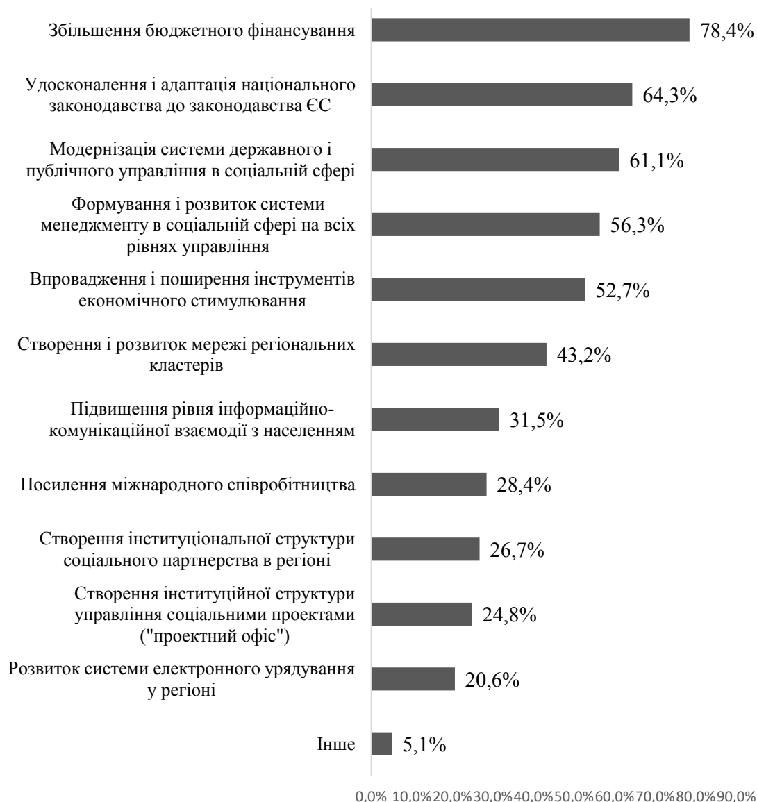
Рис. 2. Чинники підвищення ефективності управління розвитком соціальної сфери регіону (можна було обрати не більше п'яти варіантів відповідей)

і функціонування регіональних кластерів; 2) інформаційна підтримка просування кластеризації регіонального розвитку України серед суб'єктів економічної діяльності, регіональних і місцевих органів управління та громадських організацій; 3) посилення економічного стимулювання розвитку регіональних кластерів;