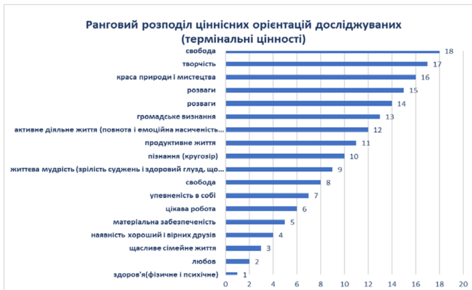
Рис. 2. Термінальні цінності курсантів

Результати емпіричного дослідження особливостей відповідальності та свободи у кур-