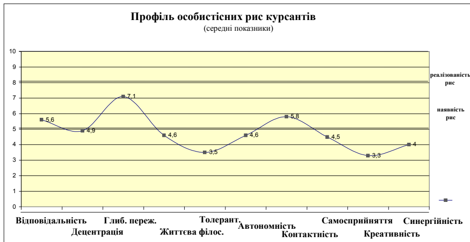
Рис. 1. Профіль особистісних рис курсантів

як криза спустошеності, криза безперспективності, криза значущих стосунків, криза особистісної автономії, криза самореалізації.