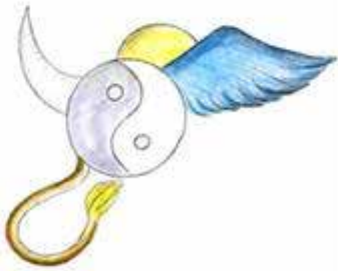
Рис. 2. Психомалюнок учасника групи АСПП: «Я – реальне, Я – ідеальне»

гойдалку» в емоційному самовідчутті суб'єкта, тому глибинний формат надання допомоги учаснику АСПП відзначається синтезом двох ліній пізнання: загальної (архаїчно універсальної) та індивідуально-неповторної в їх синтезі. Це пояснює єдиність процесу глибинно-корекційної діалогічної взаємодії, яка спирається на процесуальну психодіагностику.