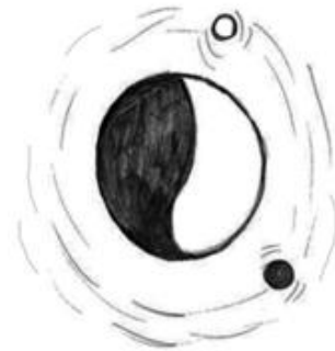
Рис. 4. Психомалюнок учасника групи АСПП: «Дорога мого життя»

періодичні узагальнення поведінкового матеріалу кожного з учасників АСПП психологом. Процес глибинного пізнання забезпечує науково релевантну платформу для здійснення діалогічного психоаналізу з невід'ємністю практичного ефекту надання неповторної допомоги людині на об'єктивному матеріалі персоналізованій візуалізації психіки. Усе висловлене дає підстави стверджувати: розроблена нами система глибинного пізнання психіки сприяє досягненню професійного акме майбутніми психологами, які проходять глибинну психокорекцію, що враховує пралогічні параметри психіки. Переваги глибинного пізнання – у єдності практики з психодинамічною теорією, недаремно існує вислів: «немає нічого більш практичного, ніж хороша теорія», а «хороша теорія» – та, яка виросла на практиці.