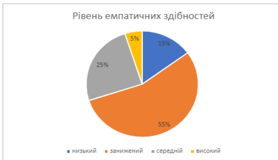
Рис. 1 Узагальнені результати, отримані за допомогою методики «Діагностики рівня емпатійних здібностей»

Методика «Самооцінка психічних станів» Г. Айзенка дозволяє діагностувати рівень три-