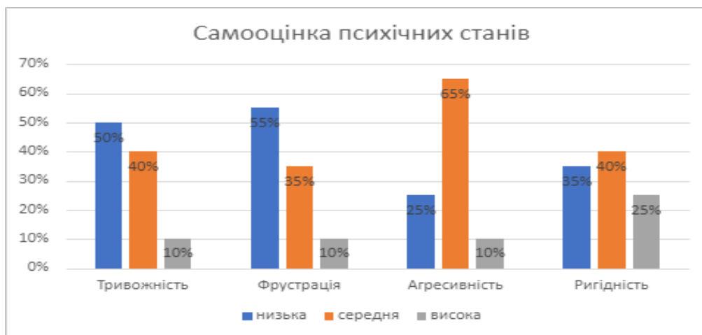
Рис. 4. Відсотковий розподіл результатів за методикою «Самооцінка психічних станів» Г. Айзенка

між студентами – це не просто обмін інформацією, вони передбачають взаємну активність партнерів. Успішність спільної та узгодженої взаємодії залежить від рівня соціальної чутливості до людей, психологічної врівноваженості та емоційної чутливості. Недостатня сформованість однієї з цих особистісних якостей може негативно впливати на процес міжособистісного сприймання та пізнання у студентському віці.