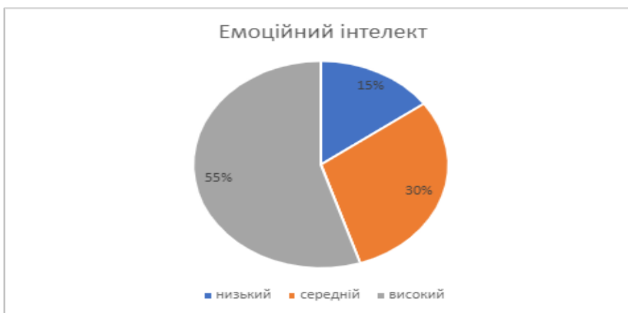
Рис. 3. Узагальнені результати, отримані за допомогою методики «Емоційного інтелекту»

можності, фрустрації, агресивності й ригідності. Показник «тривожність» свідчить, що 50% респондентів мають «низьку» тривожність; «середню» – 40%; «високу» – 10%. Більшість студентів, що брали участь в опитуванні, за даним показником виявили стабільний психічний стан, що дозволяє їм сприймати будь-яку ситуацію врівноважено. Студенти експериментують та засвоюють різні соціальні ролі, які на певний час визначають їх спосіб існування. Вхідження в нові ролі вимагає певної адаптації, механізм якої полягає у тому, щоб реальна поведінка відповідала очікуваній. Враховуючи значне інформаційно – інтелектуальне навантаження у вищій школі і непрості відносини з оточуючими, та те що навчальна діяльність у студентів супроводжуються значним напруженням і розбіжностями між бажаннями та досягненнями, тому не дивно, що за таких умов, виникає стан фрустрації. Виходячи з даних дослідження, показник «фрустрація»