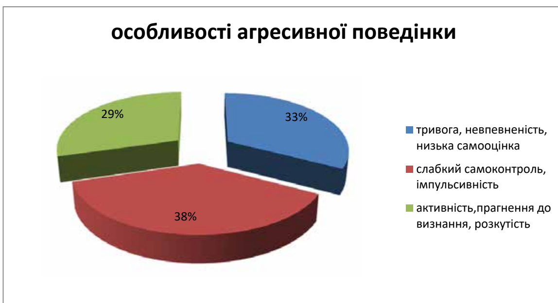
Рис. 2. Кількісні показники вияву особливостей агресивної поведінки