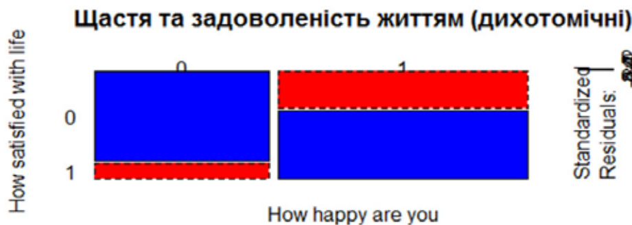
Рис. 2. Суб'єктивне благополуччя (дихотомії)

Результати, отримані у ході дослідження, свідчать про те, що суб'єктивне благополуччя вище серед жінок, ніж серед чоловіків, також СБ підвищується зі зростанням суб'єктивної оцінки матеріального становища, неформального соціального капіталу і довіри. Крім того, було виявлено, що чоловіки мають нижчий рівень формального соціального капіталу і довіри, порівняно із жінками; опитані із не комфортним матеріальним становищем мають нижчий рівень