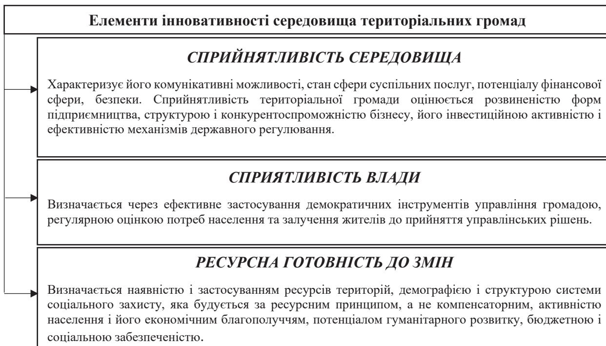
Рис. 1. Елементи інновативності середовища територіальних громад