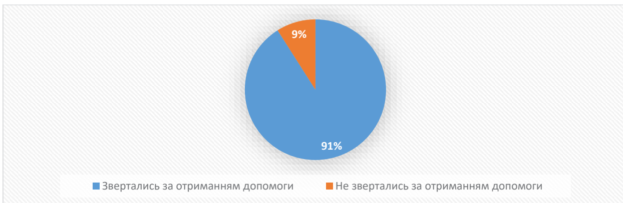
Рис. 3. Відсоток респондентів, що звертались до громади з питань отримання допомоги