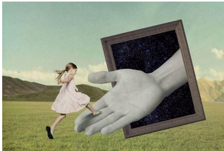
Рис. 5. Автор і назва невідомі. Назва респондента: «Підтримка»

Н.: Мені дійсно бракує підтримки, наприклад з боку чоловіка. Він мене не підтримує, а, навпаки, вказує на помилки.