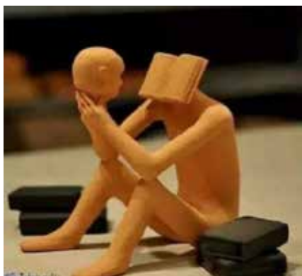
Рис. 1. Назва респондента: «Діалог із собою»

Відступи від реальності є інформативними і притаманні чи то вербальному матеріалу (як у психоаналізі З. Фрейда), чи то опрідметнено-презентативному – у психічно здорових людей (студенти психологічних факультетів). «Там» і «там» дійство (активність) побуджується енергетичним потенціалом витіснень, які інтегруються з архаїчним спадком та зберігають прагнення екстраполовання назовні. Посеред архаїчного спадку, який впливає на характер спонтанної активності кожного суб'єкта, провідну роль відіграє комплекс