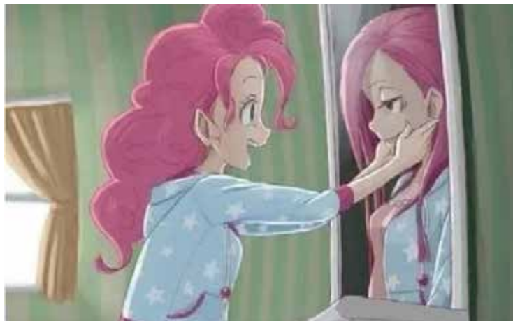
Рис. 6. Автор і назва невідомі. Назва респондента: «Як я бачу сама себе»

Н.: У мене після ваших слів легкість на душі, їжачок десь зник геть, яка це радість, коли стало легко дихати, без западання в те, що було десь і колись. Це чудо я відчула силу власної душі завдяки інтелектуальному проясненню ситуації: я кидалась на допомогу усім –тепер зрозуміла, що причиною було те, щоя сама потребувала допомоги, впевнена, що я буду більш раціональніша і мудріша у стосунках як з чоловіком, так із батьком і вони наповняться