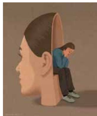
Рис. 3. Назва респондента: «Психічна роздвоєність Я»