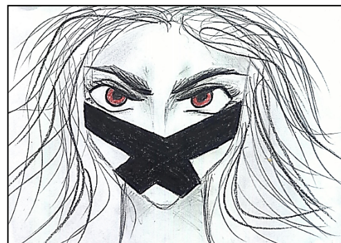
Рис. 3. Тату вини

П.: 91 Якщо це так, то на малюнку «Тату вини» агресії вистачить і на хлопчика