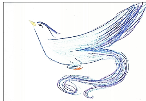
Рис. 2. Власне тату

М.: 90 Я підбрала репродукції до малюнку «Власне тату» (рис. 2). Цей малюнок (рис. 4) для мене означає прощання з тим образом хлопчика, якого чекали замість мене. Мама дуже сильно хотіла, щоб народився хлопчик, і назвати його в честь батька, а народилася я.