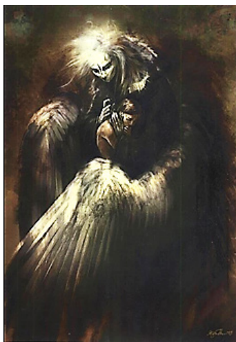
Рис. 5. В. К. Салонен. Хороша мрія

М.: 92 У комплексі моїх психомалюнків хлопчики з дівчатками не відрізняються один від одного, хіба що прикріпленим бантиком і сукнею. Це як бажання відліпитися від цього образу хлопчика (рис. 3), я залишаю йому квіточку, виходжу з води і йду кудись.