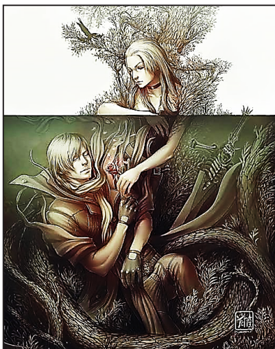
Рис. 4. В. і М. Ременар. Моя троянда

(рис. 3). Ні губ, ні дихання немає, що може бути самопокаранням за те, що ти не хлопчик, адже ніс – фалічний символ. Базальна архаїчність цієї вини, ще здавна походить з утроби. Ми по твоєму матеріалу виходили на архетип утроби, і ти сама говорила, що то «сізіфова праця», адже що б ти не робила, а бажаного батьками хлопчика не було і не буде. У такий спосіб ти марнуєш своє життя і стаєш «рятівницею» для матері, щоб вона переконувалася в тому, що добре, що ти дівчинка, бо хлопчик не був би таким співчутливим.