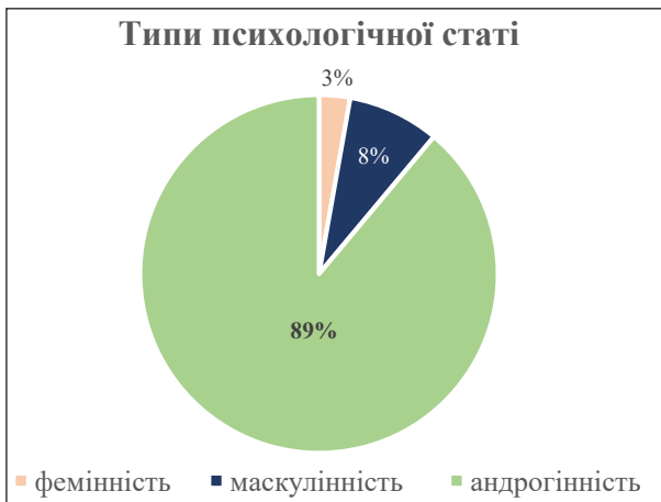
Рис. 2. Відсоткове співвідношення типів психологічної статі студентів

Як ми можемо побачити на рис. 2, згідно з результатами дослідження, серед студентів превалює андрогінний тип психологічної статі. Це свідчить про те, що досліджувані набрали найбільшу кількість балів як за шкалою мужності, так і за шкалою жіночності, вони мають однаково проявлені як жіночі, так і чоловічі поведінкові схеми.