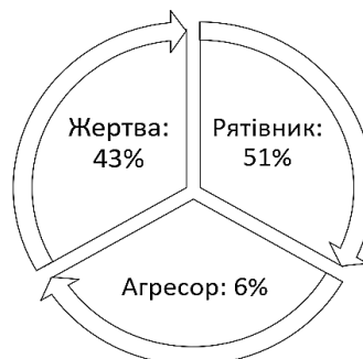
Рис. 1. Діаграма за результатами попереднього зрізу

усе ж визнали себе такими. Тоді як 43 % зазначили, що для них притаманна роль «жертви», а 51 % виступали в ролі рятівника (рис. 1).