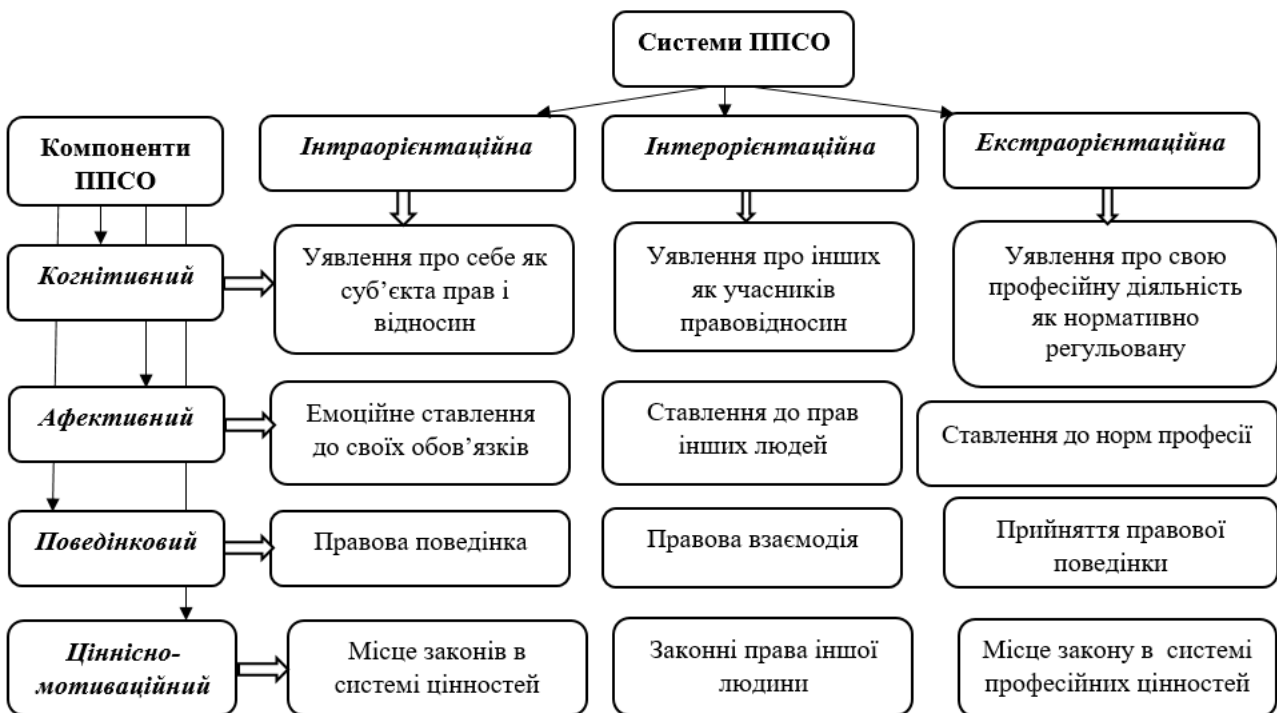
Рис. 1. Специфіка змістовно-структурних характеристик професійно правомірної спрямованості особистості

Отже, згідно з табл. 2, у другій групі було виявлено вірогідно більші показники когнітивного компонента порівняно з першою групою за статистичної значущості ( p \leq 0,05 ). Можемо