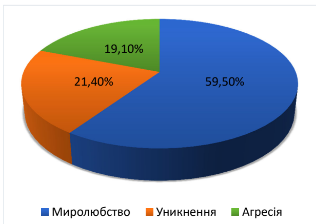
Рис. 3. Домінуючі стратегії психологічного захисту студентів-першокурсників під час спілкування

«Уникнення». За використання такої стратегії студенти значно економлять і розумові, й емоційні ресурси, намагаються не вступати в конфліктні взаємодії або з мінімальними втратами виходити з них. Цей тип реагування побудований на рисах характеру уживатися з усіма та завищеними вимогами до власного «Я» й вольовими зусиллями. У 19,1% студентів домінує стратегія «Агресія», таким студентам властиво діяти під час спілкування на основі інстинктів агресії, що є характерним і для тварин у стані небезпеки. Такі студенти легко збудливі, агресія може проявлятися грубо та м'яко. Водночас така стратегія не є негативною в широкому сенсі, така поведінка захищає людину від небажаних контактів, їх надмірної кількості під час навчання, удома, у взаєминах зі сторонніми й дуже близькими людьми. Агресія може збільшуватися під дією суб'єктивних оцінок ситуації. Такої самої думки дотримується В.В. Бойко. Він вважає, що агресивна поведінка особистості сприяє зниженню стресового впливу, протидіє дезадаптивним проявам у когнітивних, емоційних, поведінкових процесах. Проте часте використання такої стратегії особистістю під час спілкування свідчить про неадекватне реагування на умови, у яких вона опинилася, про підвищену тривожність і напруження, що є наслідком недостатньо розвинених складників комунікативної компетентності, зокрема комунікативних здібностей.