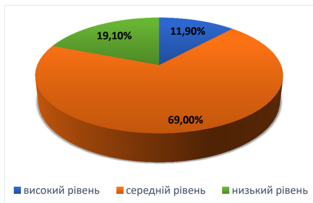
Рис. 2. Рівні розвитку адаптивного потенціалу студентів-першокурсників

Узагальнення отриманих даних за четвертою шкалою, що вимірює особистісний адаптивний потенціал, дало можливість емпірично визначити три рівні розвитку адаптивного потенціалу здобувачів (див. рис. 2).