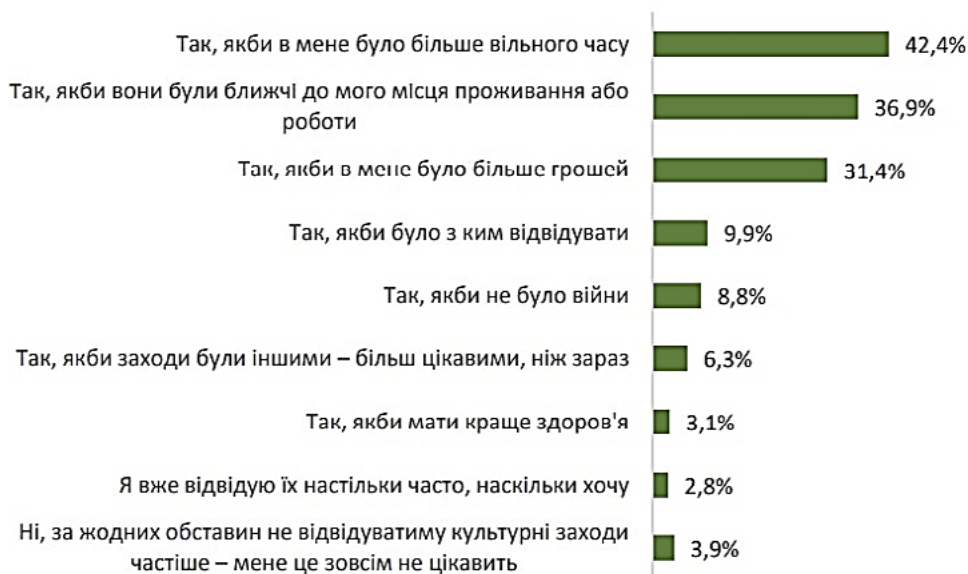
Рис. 2. Відповіді на питання «Чи є обставини, за яких Ви відвідували б культурні заходи частіше?», січень-лютий 2023 року, (n=2009), %