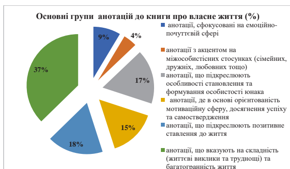
Рис. 2. Основні групи анотацій до книги про власне життя

За результатами кількісного аналізу переважання певних словесних анотацій найбільший відсоток отримали анотації, що описують складність та багатогранність життя (37%), і вдвічі менший відсоток анотації, які описують позитивне ставлення до життя (18%).