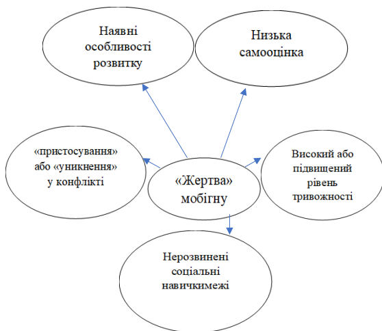
Рис. 2. Критерії фактичної або перспективної «жертви» мобінгу

Виокремлені критерії фактичної або перспективної «жертви» мобінгу представлені на рисунку 2.