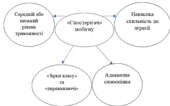
Рис. 3. Критерії фактичного або перспективного «спостерігача» мобінгу

Виокремлені критерії фактичного або перспективного «спостерігача» мобінгу представлені на рисунку 3.