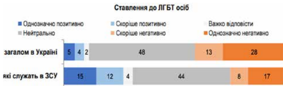
Рис. 1 Результати дослідження: ставлення населення до спільноти ЛГБТІК+ в Україні

Результати (results) та обговорення результатів (discussion). З. Фрейд (S. Freud) не розглядав гомосексуальність як патологію. Незважаючи на всі свої недоліки, З. Фрейд сприймав гомосексуальність як частину сексуальної конституції кожної людини, а отже, сама по собі вона не є проблемою. «Психодинамічні дослідження, – стверджував він у 1915 році, – виявили, що всі люди здатні зробити гомосексуальний вибір об'єкта і фактично зробили його у своїй несвідомості» [19, с. 110]. Докази продовжують