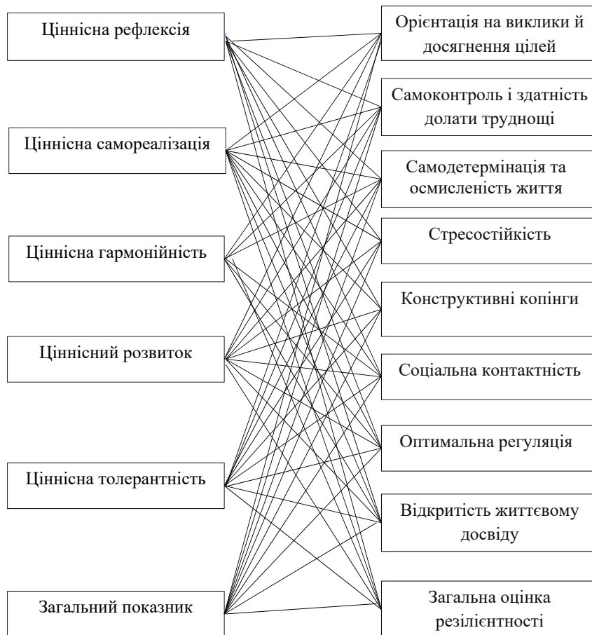
Рис. 2. Кореляційні плеяди показників аксіологічної компетентності та резиліентності

Перспективи подальших наукових пошуків полягають у вивченні детермінуючої ролі аксіологічної компетентності щодо регуляції процесів формування та розвитку резиліентності працівників Національної поліції України.