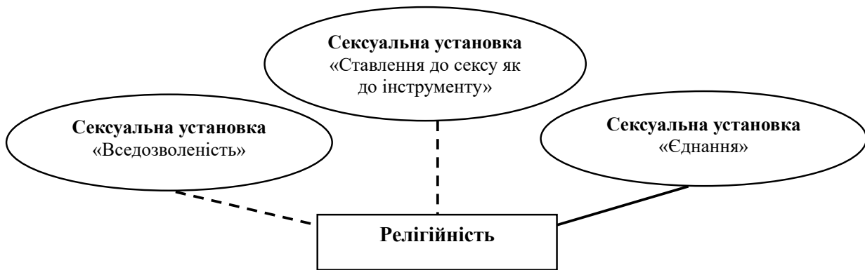
Рис. 1. Взаємозв'язок сексуальних установок та релігійності

Результати порівняльного аналізу t-тесту Стьюдента вказують, що існують статеві відмінності лише у сексуальній установці «Все-