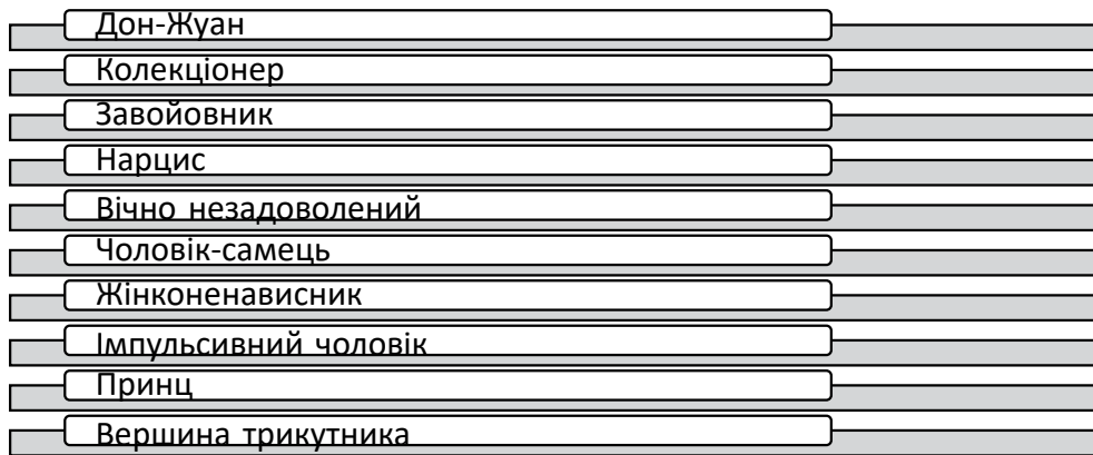
Рис. 2. Типи чоловіків, схильних до позашлюбних зв'язків [4, с. 117]

стісною аномалією. За психологічними характеристиками він має багато спільного із завойовником. Усі його стосунки зосереджені на інтересі до власної персони. Такий чоловік уміє лише брати і не розуміє значення слова «давати». Він не здатний поставити себе на місце іншого, оскільки не схильний слухати та співпереживати чужим почуттям.