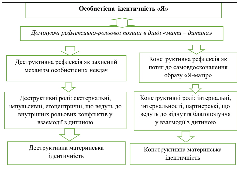
Рис. 1. Модель рефлексивно-рольового аналізу (на основі узагальнення наукових літературних джерел)

Для обох видів материнської ідентичності загальними положеннями є сукупність ознак нелінійно, динамічно розвиваючих елементів внутрішньої диспозиції, зокрема у виборі рольового репертуару, який коригується конструктивною або деструктивною рефлексією. Характер перебігу рефлексії й ролі, як інтегрованої єдності материнської ідентичності, зовнішньо фіксується в конструктивній або деструктивній ролі. Маркер конструктивної материнської ідентичності маркується спрямованістю досліджувати, критично оцінювати