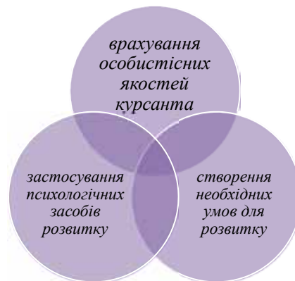
Рис. 3. Основні складові психолого-педагогічного забезпечення розвитку лідерських якостей у курсантів