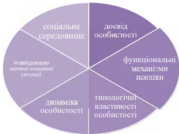
Рис. 2. Формування лідерських якостей

Розвиток лідерських якостей курсантів відображає зміни в системі психологічних якостей особистості завдяки новим умовам та ситуаціям. Одним із внутрішніх чинників активності