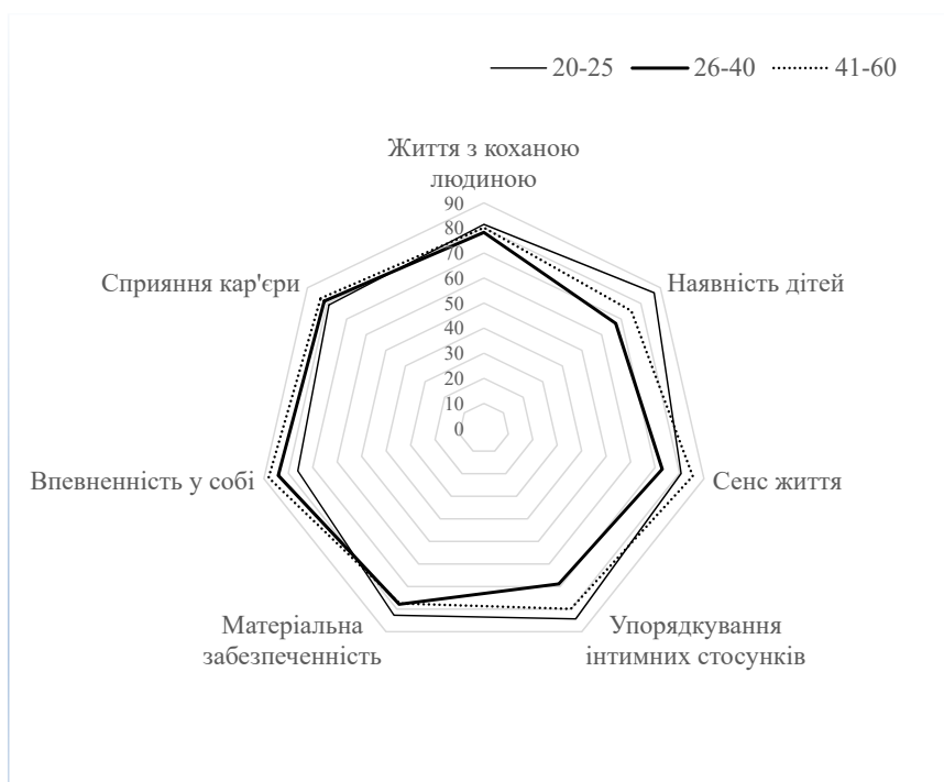
Рис. 3. Розподіл пріоритетів у сімейних цінностях (за результатами анкети)

Для виявлення структурних зв'язків та закономірностей між показниками особистісного