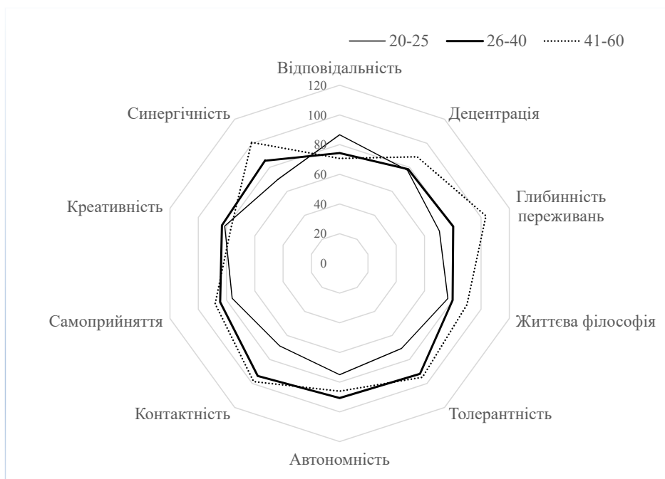
Рис. 1. Розподіл середніх показників за методикою О.С. Штепи «Опитувальник особистісної зрілості»

На рис. 2 за виступами у групових профілях можна побачити цінності, які є пріоритетними для жінок різних вікових категорій. Для дівчат віком 20–25 років основними цінностями є «ідентифікація з партнером» і «зовнішня привабливість». Жінки віком 26–40 років зосереджені на «інтимно-сексуальній сфері» та «вихованні дітей». Для старшої вікової групи значущості набуває «інтимно-сексуальна сфера». Вікові відмінності за зазначеними