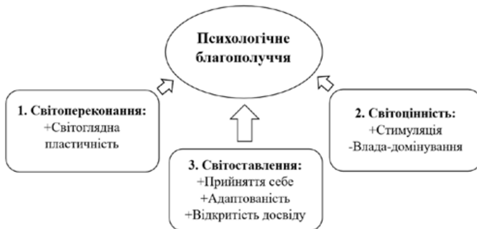
Рис. 1. Індивідуальний світогляд як чинник психологічного благополуччя

В інших публікаціях ми вже коротко згадували результати протестованої другої моделі регресійного аналізу . В ній було використано виділені нами фактори індивідуального